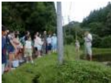
(講師の方から指導されている様子)