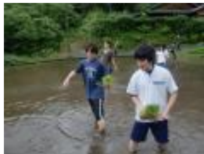
(いざ田植え開始です)