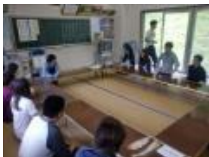
(活動後、今年度の活動について会議)