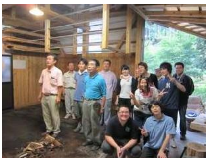
(最後は全員で記念撮影となりました)

火入れは前日から行っており、当日の午前中には、窯の中の温度は800度近くになっていました。参加者は、集落住民の指導を受けながら、夏の暑さと火の熱さの中、みなさん顔を真っ赤にしながら慣れない手つきで真剣に薪をくべる作業に取り組み、夕方にはなんとか目標の1250度に達することができました。