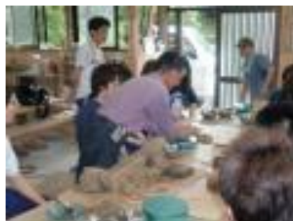
(陶芸体験もしました)