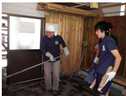
(私たちも汗だくで頑張りました)