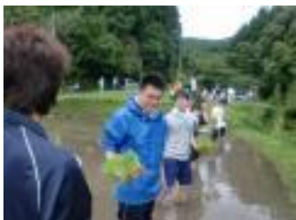
(一列になって植えていきます)