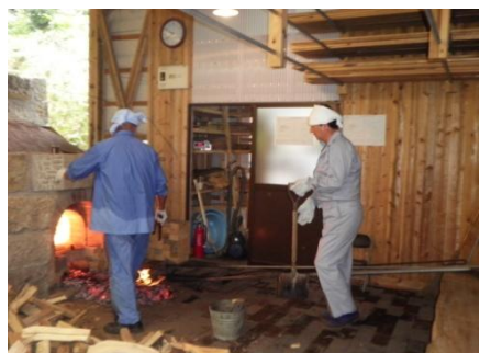
(地元の方も汗びっしょりです)

参加者25名(地域の方: 10名、一般参加者: 6名、FreeSpot: 6名、NPO・県関係者: 3名)